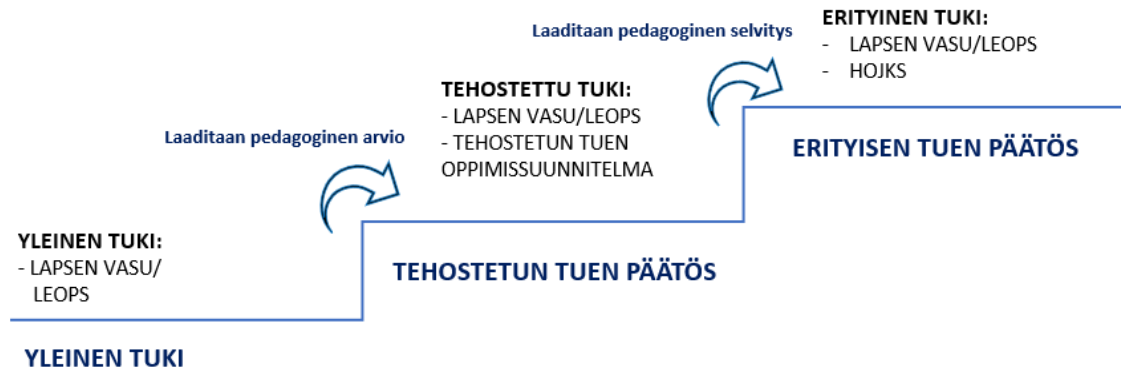
Kuvio: Tuen portaat esiopetuksessa

tukeen siirtämisestä tekee kirjallisen päätöksen 11-vuotisen oppivelvollisuuden osalta johtava rehtori erityisopettajan pedagogisen selvityksen (tms.) pohjalta. Muut erityisen tuen siirrot tekee varhaiskasvatusjohtaja erityisopettajan pedagogisen selvityksen tms. pohjalta. Erityisestä tuesta laaditaan HOJKS eli henkilökohtainen opetuksen järjestämistä koskeva suunnitelma.